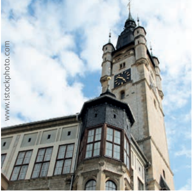
Im Rathaus von Dessau-Roßlau hat die Ausländerbehörde ihren Sitz.