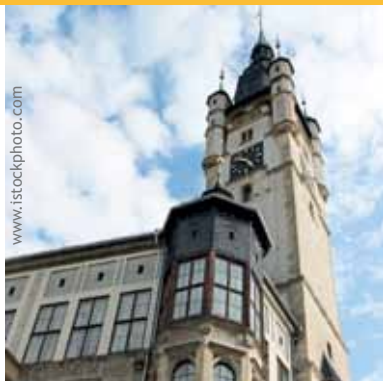
德绍-罗斯劳的外管局座落在市政府办公楼内